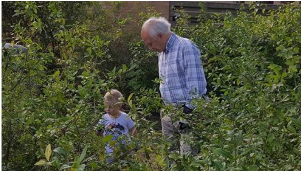
Billede fra havedagen i 2018 – Revisoren får hjælp af en yngre beboer

Det lykkedes at samle en flok beboere til en fælles havedag d. 8 september, hvor opgaven var at luge kraftigt ud i den lave beplantning på volden ud mod Niverødvej. Vi kom igennem hele volden på de 3 timer, der var afsat og som det fremgår af billedet, fik unge og ældre beboere anledning til at møde hinanden. Stor tak til alle der deltog.